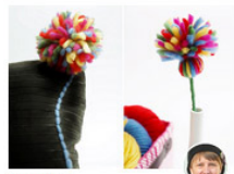
KITSCHWERK Blumenkissen Pompom