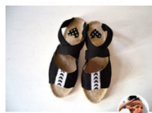
VIBELICH Sandalen mit Espadrilles Sohlen