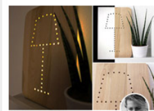
GINGERED THINGS LED Lampe