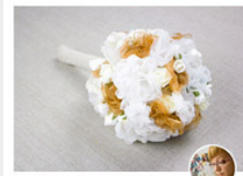
KREATIVLABOR BERLIN Brautstrauß mit Stoffblumen