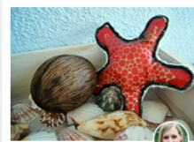
FANTASIEWERK Druckfische aus Stoff