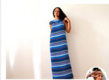
VIBELICH Das 5 Minuten Maxikleid